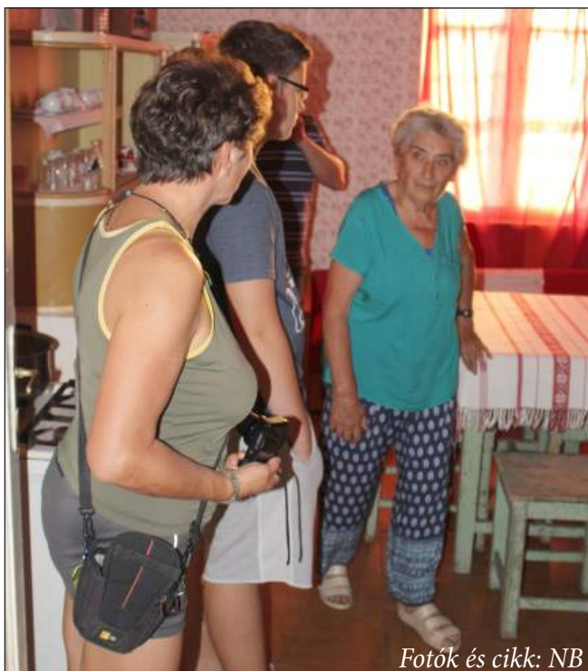
Fotók és cikk: NB

Helytörténeti jelentőségű állomásokat látogattunk meg a nemrégiben elindított „Kétkeréken a múlt nyomában” kerékpáros túra első két alkalmán.