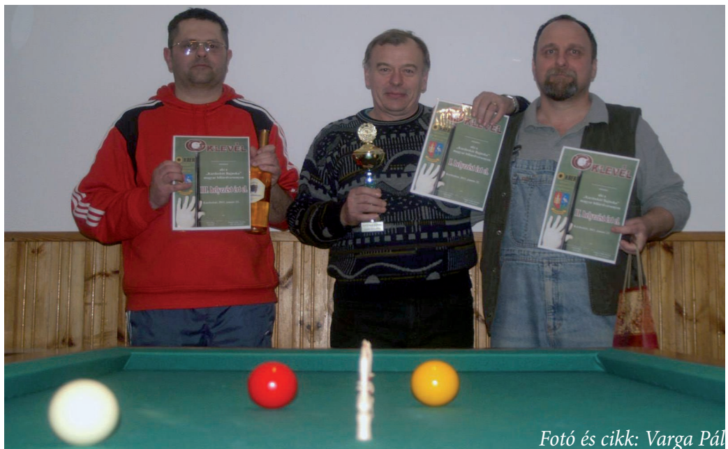
Fotó és cikk: Varga Pál

Már a versenyre való felhívás is hozott eredményt: délutánonként biliárdozó emberekkel volt teli a művelődési ház előtere. Kortól függetlenül sokan készültek a megméretésre, hiszen középiskolástól nyugdíjas korúig volt résztvevőnk. A versenyre végül tizenötön adták be a nevezésüket. Mivel páratlan volt a nevezők száma, így egy főt - Kis Bá-