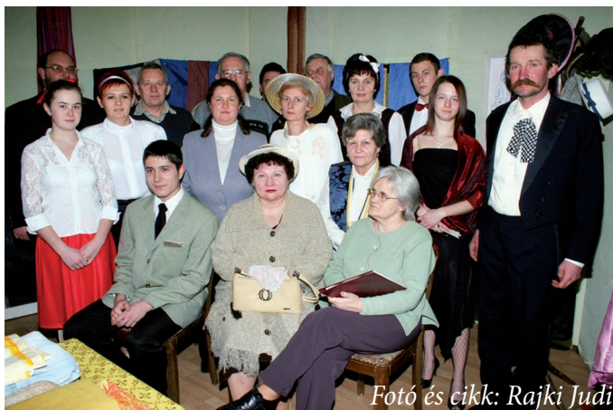
Fotó és cikk: Rajki Judit

A Magyar Kultúra Napja alkalmából Rejtő Jenő: Egy görbe éjszaka című bohózatát láthatták az érdeklődők három felvonásban. A két órás előadás sokszor könnyeket csalt a nézők szemébe, de nem a meghatottságtól, hanem a nevetéstől sírtak. A gyerekek és a felnőttek egyaránt élvezték